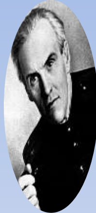
Николай Тихонов орыс жазушы

«Абай жолы» арқылы қазіргі қазақ прозасы күллі дүние жүзі әдеби классиканың шырқау шыңына шықты. Сөйтіп, 19 ғасырдың 40-50-жылдарын М. О. Әуезов туған әдебиетіміздің даму тарихында бұрын-соңды болып көрмеген ренессансқа айналдырды. Мұның өзі заңды да, өйткені «Абайдай» шығарма бұл тұсқа дейін қазақ әдебиетінде болған емес» Мүсірепов Ф.