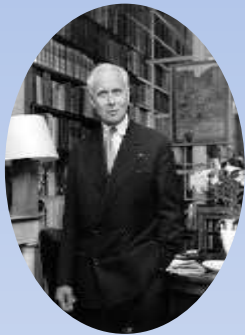
Луи Арагон француз жазушы

"XX ғасырдағы ең үздік шығармалардың бірі"